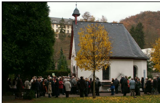
Sanctuaire d'origine à Schönstatt