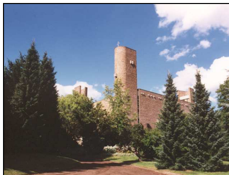
Eglise de l'Adoration